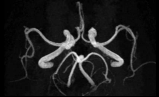
TOF 3D axial con HyperSense 3:04 min.