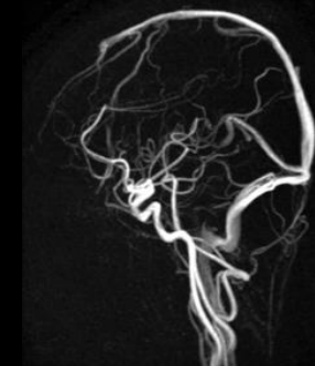
Sagittal Inhance 3D Velocity Permite imágenes vasculares sin contraste