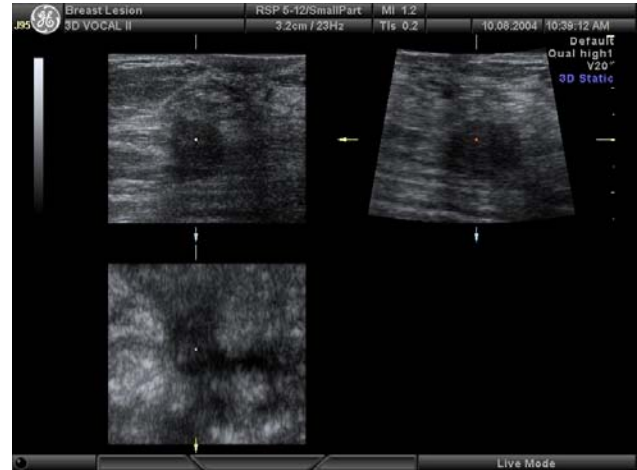
Bei 6 Uhr links